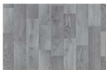
2. (madera de) roble