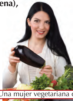
a Una mujer vegetariana de 30 años